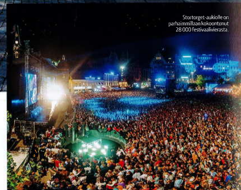
Stortorget-aukiolle on parhaimmillaan kokoontunut 28 000 festivaalivierasta.