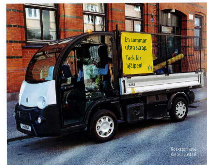
Roskaton kesä. Katos avställt!