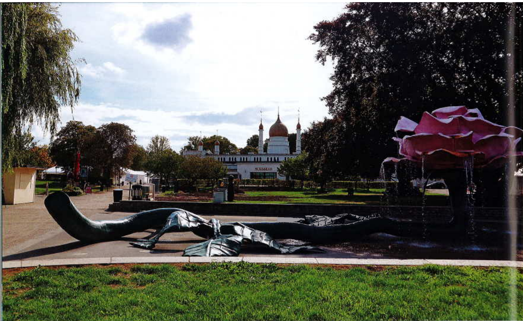
Folkets Park -kansanpuistossa sijaitseva historiallinen Moriska Paviljongen on yksi Malmön monista kokouspaikoista.

Mies- ja naisesiintyjien määrä tulee olla tasapainossa.