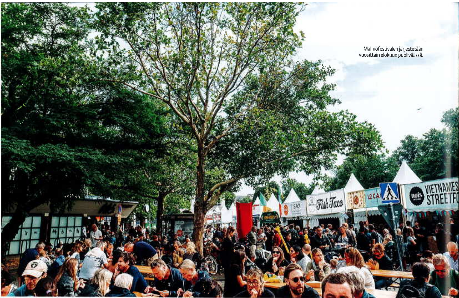
Malmöfestivalen järjestetään vuosittain elokuun puolivälissä.